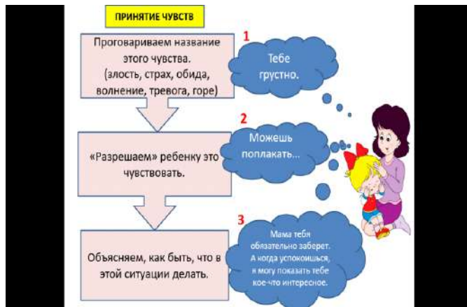
рис.2. Алгоритм поведения педагога

Педагоги получают задание сформулировать высказывания так, чтобы были приняты чувства ребенка в соответствии с алгоритмом (рис.2).