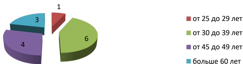
Диаграмма № 2. Возрастной состав педагогического коллектива МАДОУ №42

Предметом особой заботы в ДОУ является становление молодого воспитателя (Диаграмма № 2)